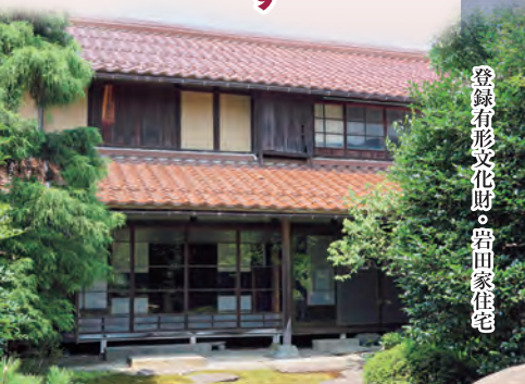
登録有形文化財・畠田家住宅

地元企業の連携を強め、地域産業を市民の文化的生活の向上につなぎ、鳥取の魅力に磨きをかけ、地域間交流を推進し、鳥取を世界に誇るべき文化産業都市とし、訪れる人が住みたくなるまちにします。