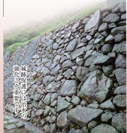
城跡保護には治水の強化こそ重要です

先人の知恵に学び、災害時のウィークポイントを洗い出し、強靱なまちづくり計画を進めます。歴史的な裏付けのある防災対策で、安全で快適な鳥取を実現します。